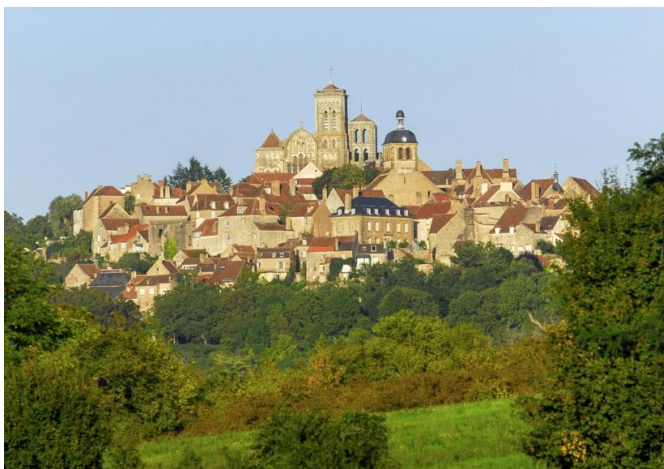
op de hoogte...

In de eerste plaats om de schitterende Basiliek de Sainte-Marie-Madeleine . Wanneer je Vézelay als pelgrim nadert zie je de basiliek al van verre.