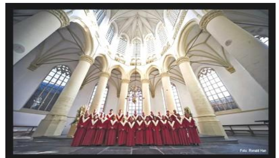
De leidse Cantorij