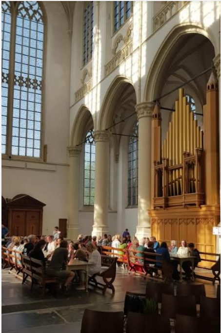
Eten in de kerk en de volgende dag weer op pad