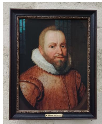
Justinus van Nassau

Afgelopen donderdag 16 mei is in de Hooglandse Kerk een schilderij onthuld waarop te zien is Justinus van Nassau, nakomeling van Willem van Oranje. Het is een replica van een in Amsterdam op een kunstbeurs opgedoken schilderij. Zoals bekend ligt Justinus, de enige bastaardzoon van Willem van Oranje, sinds 1631 begraven in de Hooglandse Kerk. Een indrukwekkende grafsteen markeert de grafkelder waar hij samen met zijn vrouw Anna van Merode (overleden in 1634) begraven ligt. Zo krijgt, dankzij bemiddeling van de kunsthandelaar en toestemming van de eigenaar van het schilderij, Justinus een "gezicht" in onze kerk