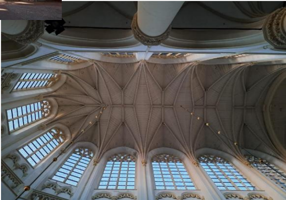
Het wordt ochtend in de kerk